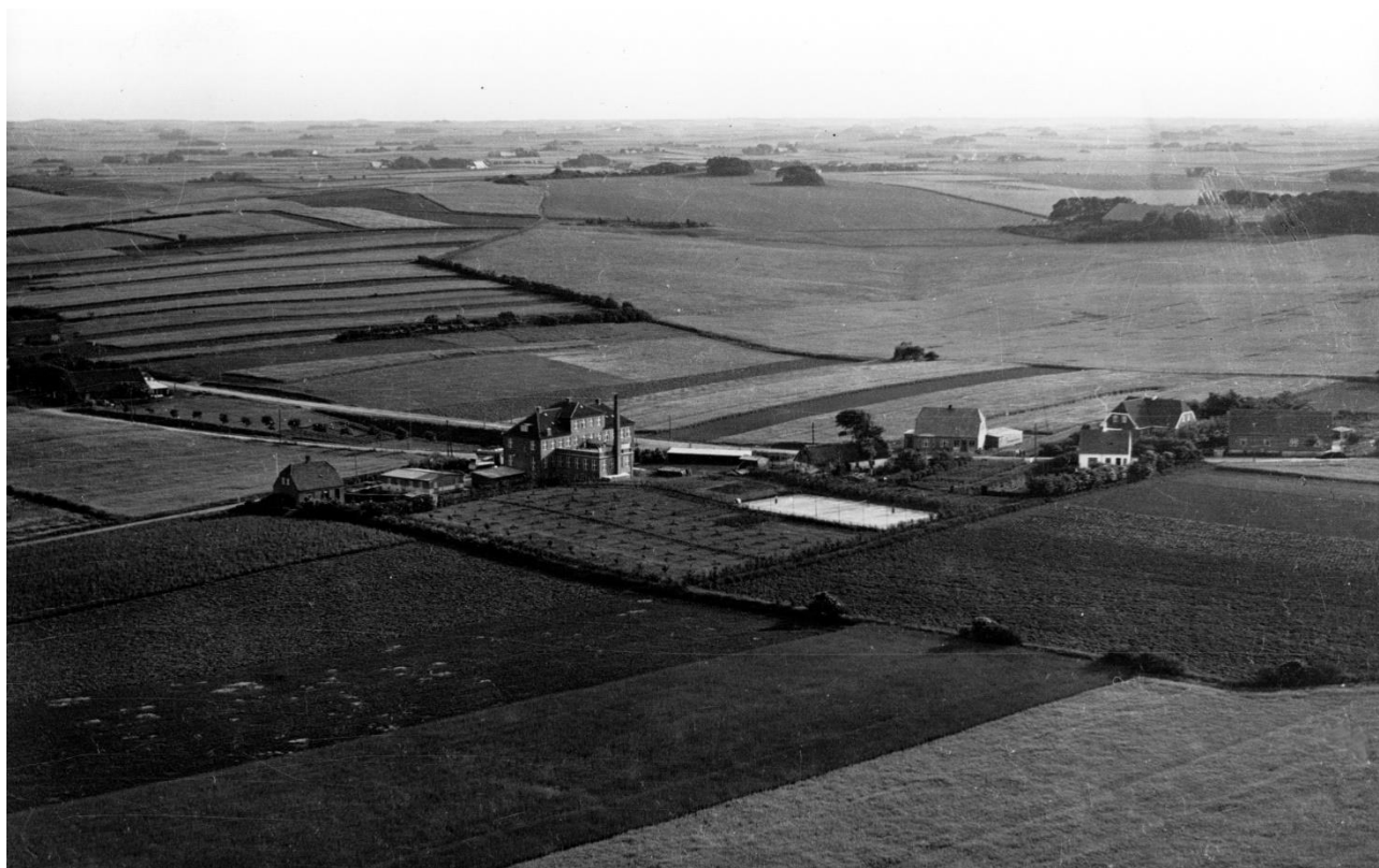
Bang & Olufsens første fabrik fra 1927. Fabrikken blev sprængt ved schalburgtage i 1945, hvorefter en ny fabrik blev bygget på samme grund.

B&O byggede sin første fabrik i 1927 lige syd for kommunegrænsen med Struer Købstadskommune mod nord og landkommunen Gimsing mod syd. Et par år forinden havde de to unge ingeniører Svend Olufsen og Peter Bang startet deres virksomhed på familien Olufsens gods, Quistrup, men deres foretagende voksede sig hurtigt for stort til loftsværelset på ejendommen. Den første fabrik lå for sig selv omgivet af marker, men fik snart selskab af enkelte beboelsesejendomme i området. Grundlaget for et boligkvarter i Gimsing blev lagt med den første radiofabriks grundsten.