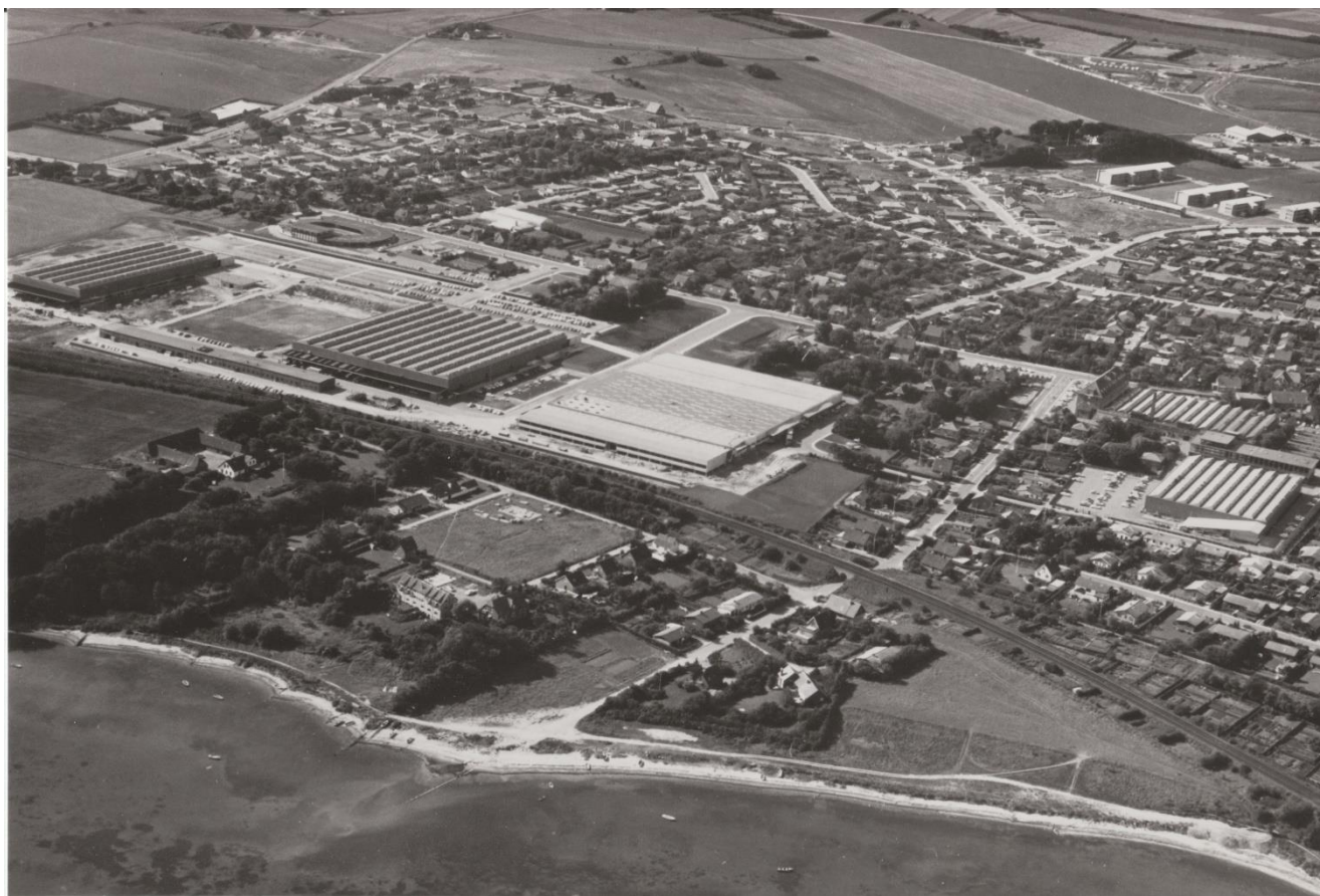
Luftfoto over Gimsing og fabrikkerne, 1972.

B&O-byen var altså ligesom andre moderne fabriksbyer præget af den øvrige byudvikling – også i langt højere grad end de tre områder, som jeg sammenligner med senere – og særligt i tiden efter kommunalreformen smeltede området sammen med resten af Struer. Det var også langt fra udelukkende B&O-medarbejdere og deres familier, der bosatte sig i Gimsing, selvom koncentrationen var stor. Udviklingen i B&O-byen handlede i høj grad om lokale kommuner som aktive parter, om parcelhusudviklingen som en kontekst på nationalt plan og om en planlægningsstruktur, hvor udstykninger og behovet for boliger fulgte hinanden løbende. Bydannelsen var ikke et udtænkt og på forhånd planlagt projekt på tegnebrættet som andre lignede bebyggelser ved og af virksomheder. B&O har ikke spillet en stor rolle i udviklingen af området, og relationen mellem fabrik og by må derfor afsøges andetsteds.