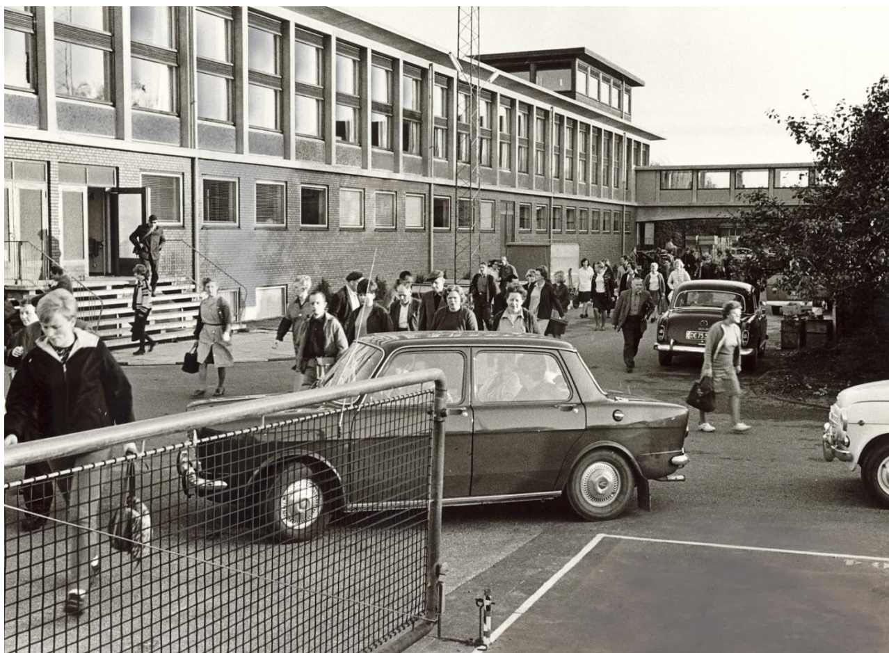
Fyraften på B&O.