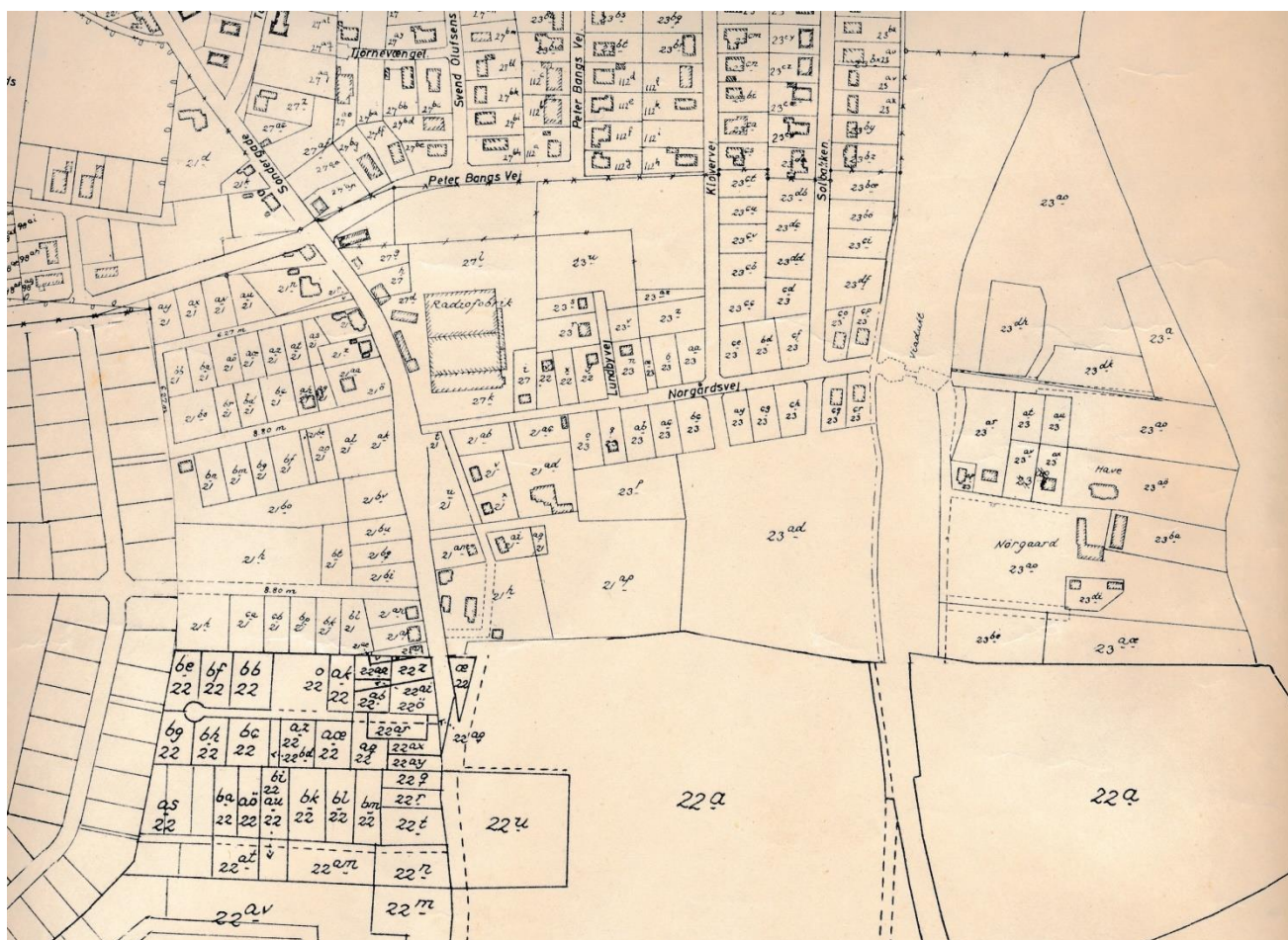
På kortet ses udstykninger i Gimsing ved radiofabrikken, 1963.