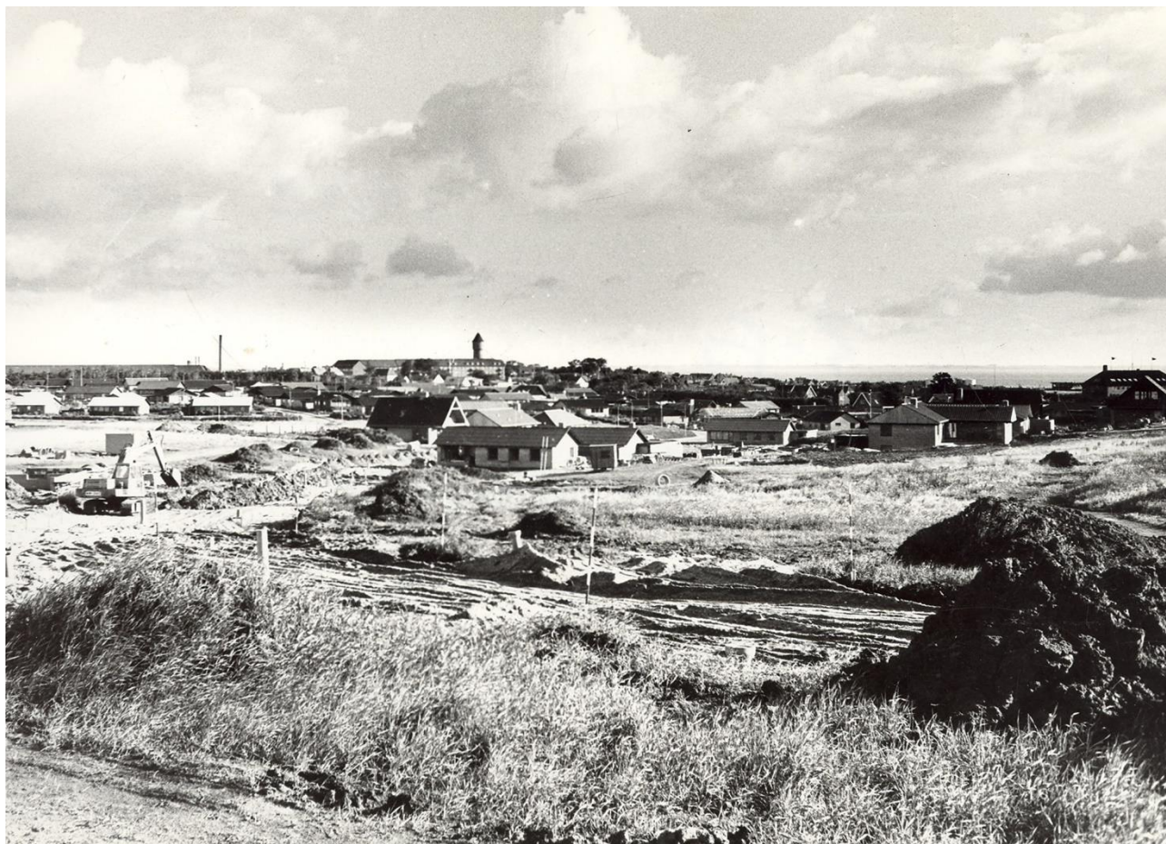
Byggemodning af grunde i Gimsing.