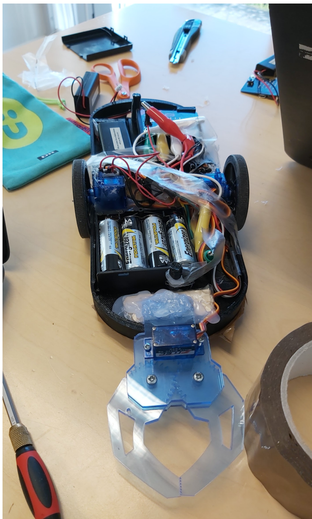
Figur 1 – Mars Rover