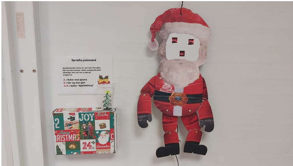
Figur 3 – Interaktiv sprællejulemand