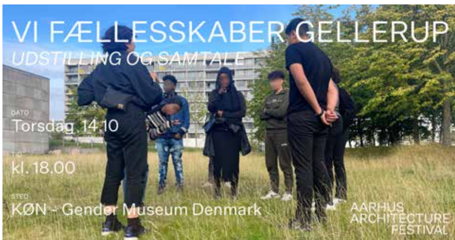
Ill. 8,15 og 8,16. Titelbillede fra kunstvideoen Collective Amnesia – Update within the Crisis . Annoncering af udstilling og samtale om Vi fællesskaber Gellerup i forbindelse med Aarhus Architecture Festival, oktober 2021.