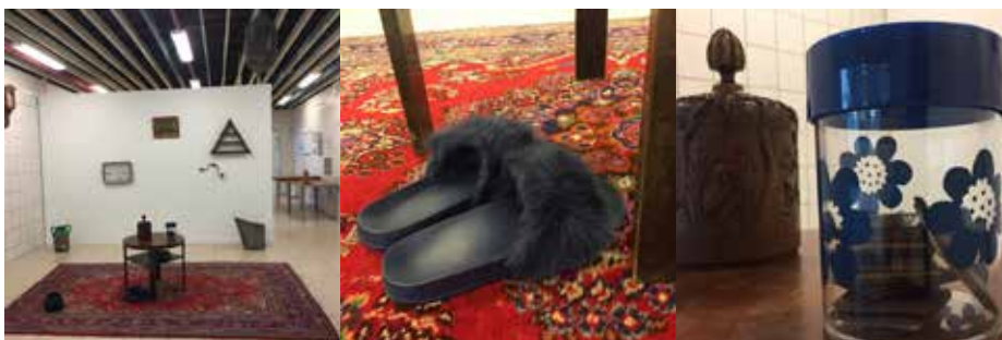
Ill 7,8, 7,9 og 7,10. Udstillingen Dagligstuen.

Det lykkes på mange måder hen over sommeren og i den efterfølgende periode at etablere KunstVild som et samlingspunkt for kunst i Værebropark. Butikken bliver et sted, som beboerne og andre aktører i området kender, hvor kunstnerne kan møde dem, og hvor de bringer deres netværk af andre kunstnere ind. For nogle af beboerne bliver KunstVild et særligt sted, som de vender tilbage til igen og igen og udvikler en tilknytning til. Her beskriver en af beboerne, hvorfor han personligt begynder at kigge forbi butikken, når der er åbent: