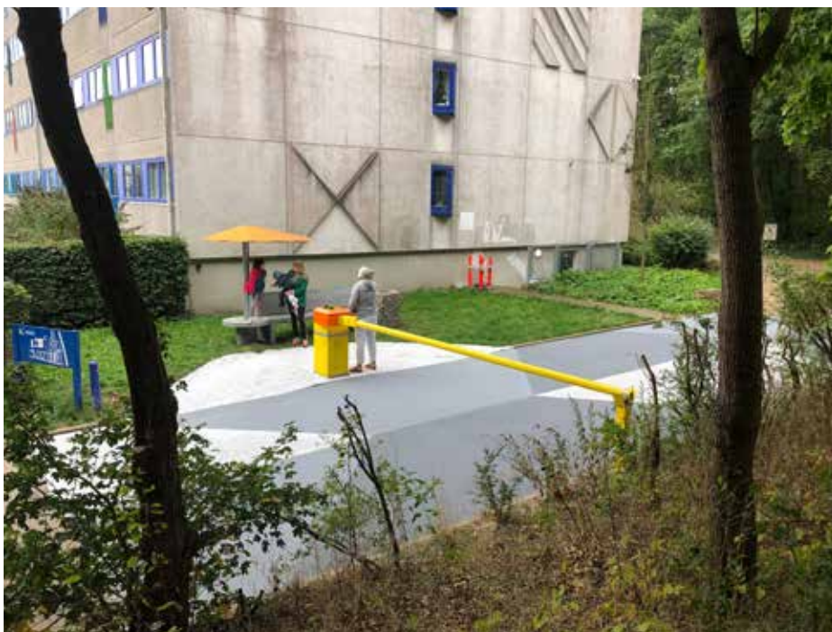
Ill. 7,4. Pausen. Kunstner: Javier Tapia. Kunst i Værebros Park. Støttet af Statens Kunstfond. Foto: Javier Tapia.

I den foreløbig sidste del af kunstsatsningen i Værebros Park realiserer Tapia, Aabille og Larsen tre permanente værker i området i 2020-22. Tapia skaber værket Pausen (2020), et kombineret opholds- og mødested for enden af en af de høje blokke. Værket, der består af en bænk, en parasol, et askebæger og bemaling af en bom og asfalten foran bænken, er skabt på foranledning af det lokale blokråd og omskaber et ellers ubenyttet ikke-sted til et opholdsrum, der samtidig fungerer som en adgangsport til Værebros Park ved en af trapperne, der leder ind og ud af området fra omfartsvejene.