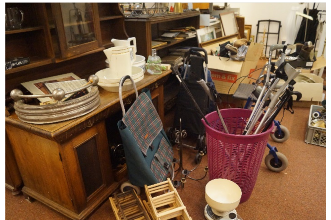
Det opvarmede lager i centrum af Aakirkeby giver foreningen mulighed for at tage imod alle typer af genbrugseffekter, herunder tøj og polstrede møbler.