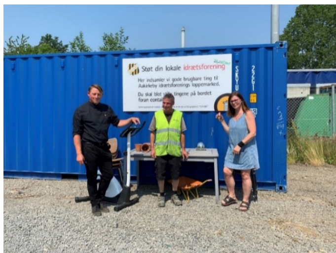
Figur 1 Donationscontainer i Aakirkeby er én af de to donationscontainere i FUTURE projektet.

Kort efter historien om det første FUTURE samarbejde var kommet ud, blev BOFA kontaktet af en ny forening, der også gerne ville være med i ordningen. Og så blev det sådan at BOFA indkøbte endnu en container og kørte forsøget på 2 genbrugspladser.