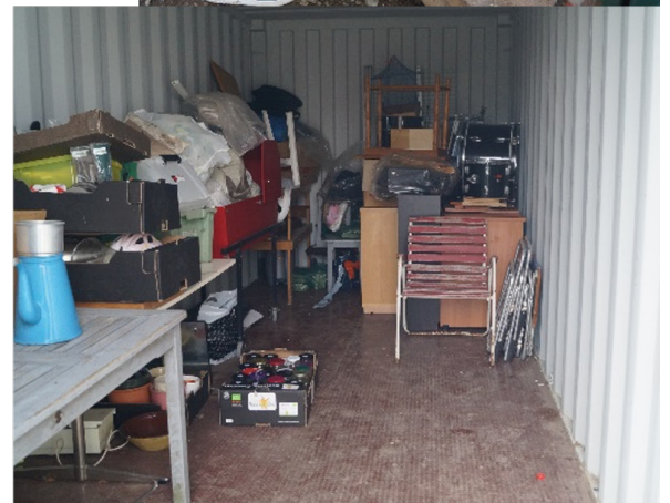
Genbruget til Aakirkeby Idrætsforening stammer fra effekter der doneres direkte fra borgerne der besøger genbrugspladsen samt genbrugelige effekter som er havnet i containerne på genbrugspladsen (n.tv.). Billedet nederst th. viser donationscontaineren indefra.