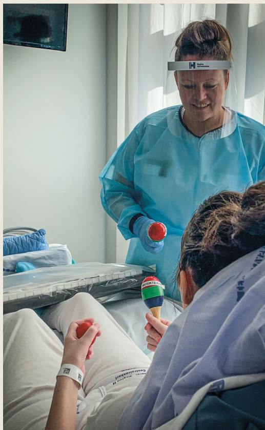
Rytme og impro ved parese