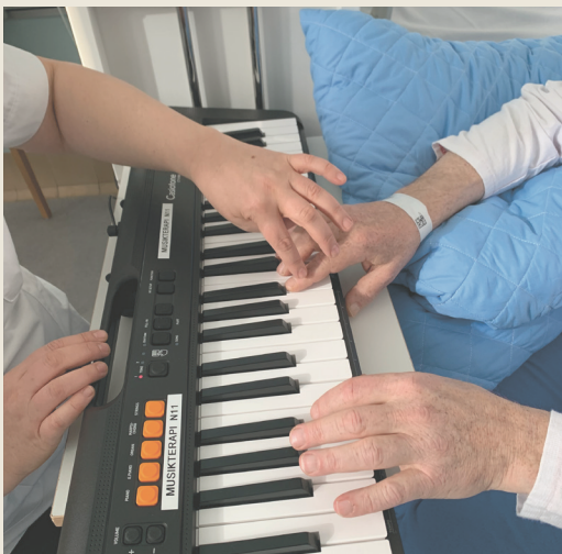
Træning af paretisk hånd på klaver