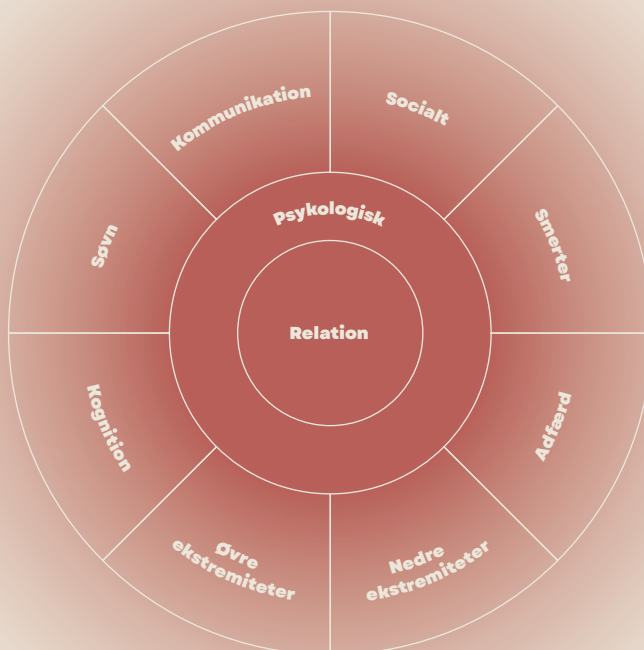
Figur 1. Musikterapi i neurorehabilitering, MTIN.

Jeg anvender MTIN som et assessmentredskab i de første møder med patienten, og gennemgår her alle kategorierne. På den måde udreder jeg hvilke områder, jeg vil fokusere på i musikterapien for at hjælpe patienten bedst muligt. Endvidere udfylder jeg en musikprofil med foretrukket og ikke-foretrukket musik.