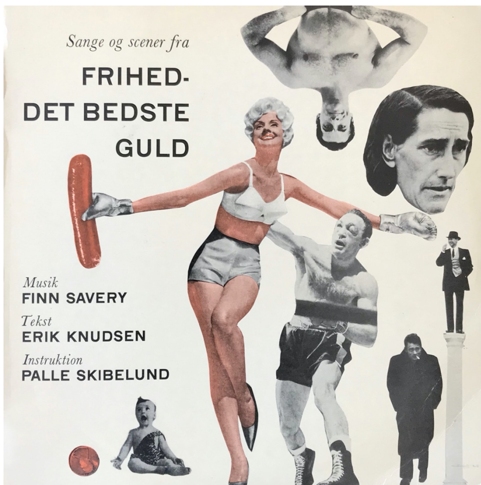
Den første teatersucces (LP-cover 1961)

Musikken har jazz som grundlag og indslag af talrige andre genrer: cha-cha-cha, rhythm & blues, højskolesang, vals og slagere – sangnumre med direkte og slagkraftige melodier, intense rytmer og præcis harmonik og instrumentation. Frihed – det bedste guld havde premiere i april 1961 på Vesterbros Ungdomsgård, og det blev noget af en sensation.