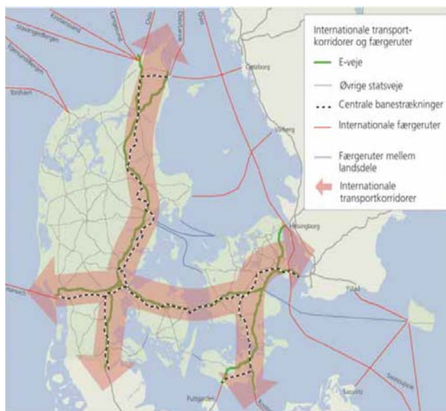
Grundstrukturen i Danmarks infrastruktur, herunder «Det store H». (Fra Infrastrukturkommissionens Betænkning, januar 2008)