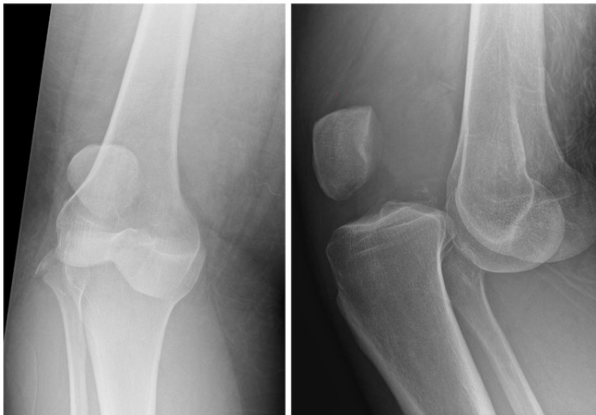
FIGUR 1 Røntgenbilleder i to plan af et lukseret højre knæ.

Op til 50% af knæluxationer menes at være spontant reponerede ved ankomst til hospitalet [6]. I et studie af Wascher et al [7] fandt man en lige så høj forekomst af karskader på a. poplitea hos patienter, som præsenterede sig med multiligamentskade og formodet spontant reduceret luksation. Patienter med spontant reponeret knæluxation kan være udfordrende at diagnosticere, hvilket udgør en risiko for ikke at erkende den primære skade og som følge heraf overse akut behandlingskrævende skader på kar og nerver.