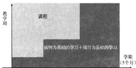
图 2 奥尔堡大学医学院 PBL 模式

2006 年,奥尔堡大学新成立的医学院除了保留以项目为基础的 PBL 教学模式之外,还采用了以病例为基础的 PBL 教学模式。这两种 PBL 教学模式的结合,构成了奥尔堡大学医学院的 PBL 教学特色,详见图 2。