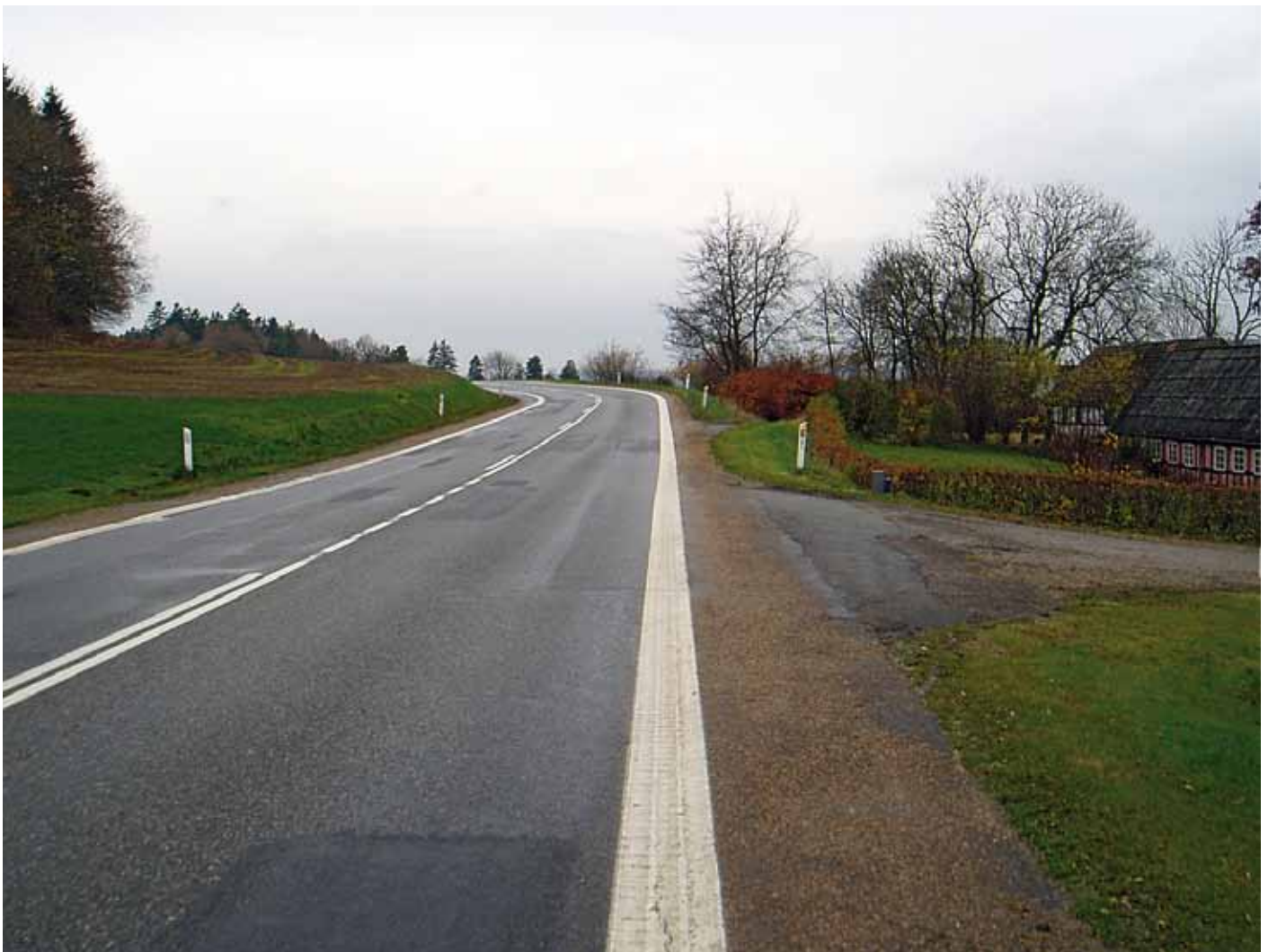
Figur 1. Flere undersøgelser bekræfter, at kurver udgør en væsentlig uheldsfaktor. F.eks. kan dårligt afmærkede kurver som denne være vanskelige at registrere i mørke eller dårligt vejr.

Det forventede resultat i 2014 er en praktisk anvendelig metode baseret på vejkarakteri-