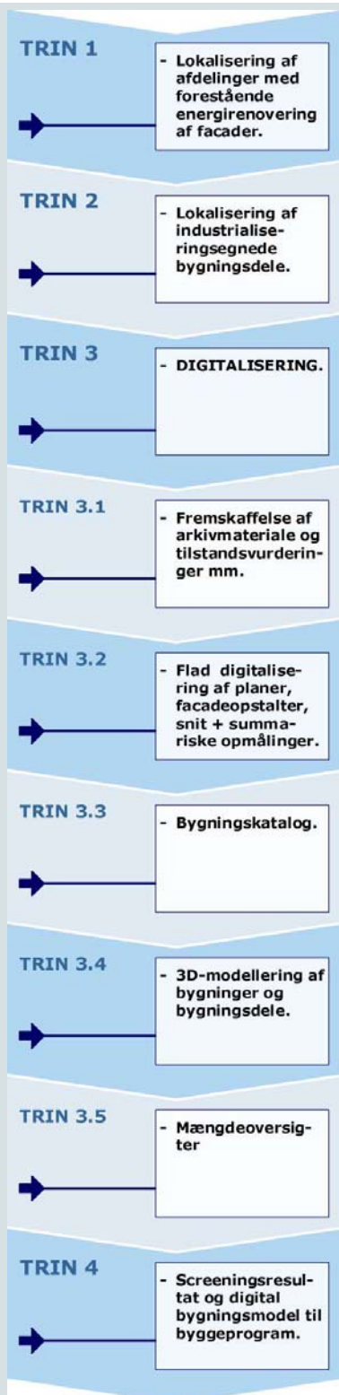
Figur 3: Procesplan - MED digital tilgang

Screeningen af industrialiserede bygningsdele Med digital tilgang er som vist i Figur 3 opdelt i 4 trin.