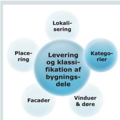
Figur 1: Bygningsdele opdeles i kategorier