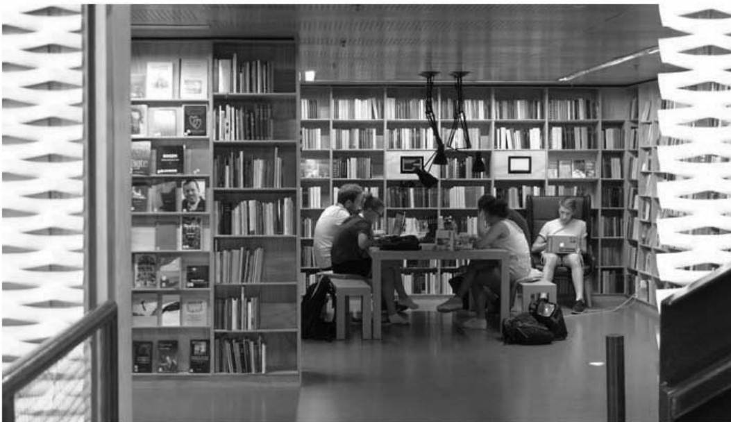
Figur 5. Halvlukket arbejdslokke. Her er skabt en rolig atmosfære. De tunge materialer dæmper lyden af samtalen. Målet har formentlig været at skabe en oplevelse af det klassiske bibliotek. Trods de moderne møbler er bibliotekets klassiske arbejdsstemning til stede. (Foto: Gitte Marling, maj 2012)

Der er brug for et nyt arkitekturbegreb for arkitektur, der gør kroppen til centrum for oplevelsen. På samme måde som bibliotekets ledere og ansatte medarbejdere udfordres i deres vanlige forestillinger vedr. bibliotekets rolle, indretning, organisering og drift,