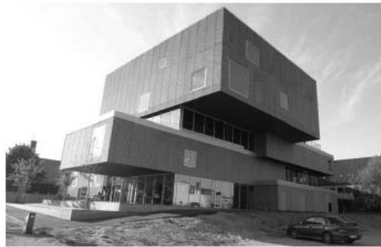
Figur 1. Som en stabel af bøger ligger bygningskompleksets forskellige afdelinger over hinanden. De forskyder sig i flere retninger og 'rækker' så at sige ud mod kvarteret. Bygningens performance signalerer, at den rummer mere end en funktion. (Foto: Gitte Marling, maj 2012)

Gitte Marling, Professor, arkitekt ph.d., Institut for arkitektur og medieteknologi, Aalborg Universitet (marling@create.aau.dk)