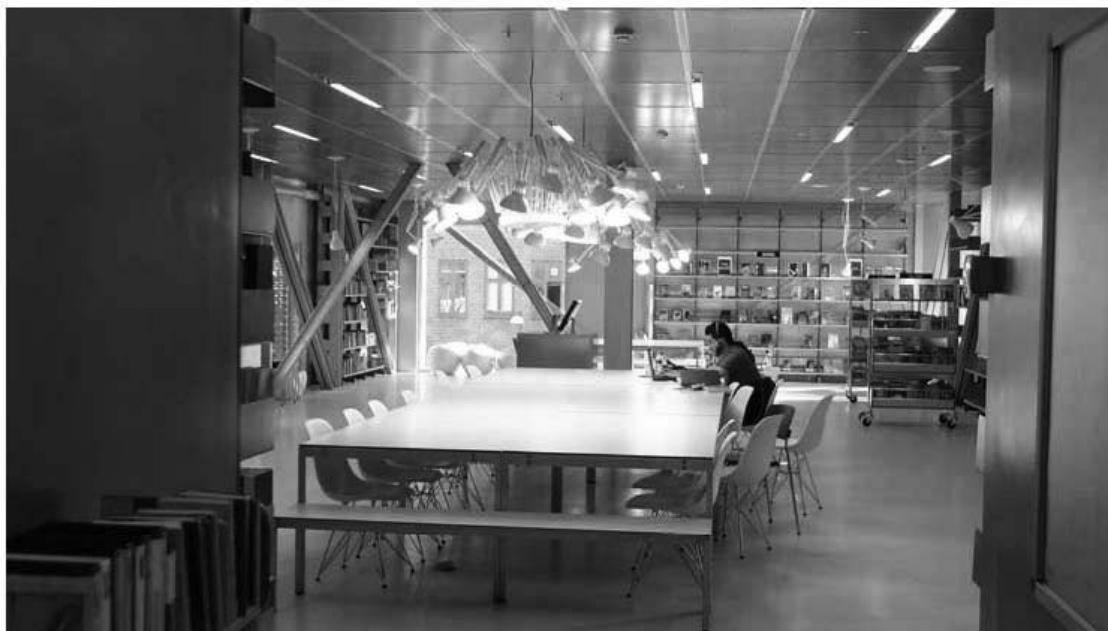
Figur 6. 'Ung/Medier' står der på skiltet, der peger ind i et stort lyst rum. Ved hjælp af arkitektoniske virkemidler er der skabt et moderne arbejdsmiljø. Virkemidlerne er bl.a. lysstofrør i loftet; loftslamper, der giver masser af lys, og metallofter, der reflekterer lyset. Her er en let arbejdsstemning og en strejf af ungdom. (Foto: Gitte Marling, maj 2012)

I trapperummet, eller atriet, åbner bygningen sig både vertikalt og horisontalt. Det er trappeanlægget, der fanger blikket. Man lægger uvilkårligt nakken tilbage for at se hele vejen op. Trappen og forløb af reposer danner et centralt rum - et 'piranesisk rum' - der funktionelt og visuelt forbinder bygningens forskellige planer, samt den nye og gamle del af bygningskomplekset. I atriet eller trapperummet er det fra arkitekternes side gjort helt tydeligt, at bygningskomplekset består af to selvstændige bygninger, der er knyttets sammen af en glasoverdækket indre gade, med døre i begge ender. Den 'gamle' grå bygning har samme pudsede overflade ude som inde. Bygningen er i stuetaen åbnet op til den indre gade med en arkade. Den nye bygnings metalbeklædning er også ført konsekvent igennem inde i huset. Den udvendige