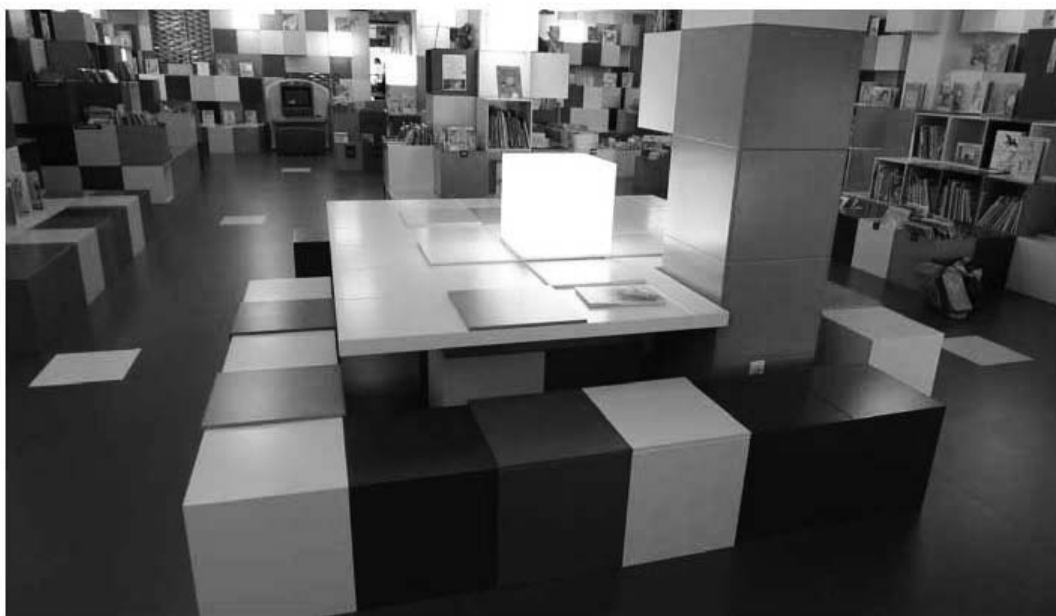
Figur 7. Børnebibliotekets klatrevæg. Der er anvendt et byggesystem af klodser, der kan minde om LEGOs klodser. Det er nærliggende at formode at arkitekterne har villet give rummet en for børn genkendelig kode for leg. Bibliotekarerne har imidlertid følt trang til at stille bøger frem over alt på klatrevæggen. De har åbenlyst set klatrevæggen som en reol. (Foto: Gitte Marling, maj 2012)

De nævnte eksempler fra casestudier giver svar på spørgsmålet om, hvorledes bygningskomplekssets enkelte funktioners egenart og identitet, kan underbygges med arkitektonisk formsprog virkemidler.