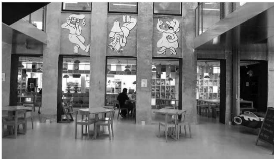
Figur 8. Kig fra børnebiblioteket ud i atriets / den indendørs gade og videre ind i cafeen og køkkenet. Huset er transparent på tværs, hvilket giver en oplevelse af det hybride kulturhus mange programmer.

Der er ikke tale om en tilfældig valgt case, men derimod en bevidst valgt såkaldt 'ekstrem case' (Flyvbjerg 1991). Casestudiet har haft til formål via sin særlige karakter at vise, ikke hvordan biblioteksarkitektur i Danmark fungerer generelt; men derimod at vise, i hvilken retning udviklingen går med større og mere sammensatte og komplekse kulturprojekter, hvor biblioteket blot er et af mange programmer.