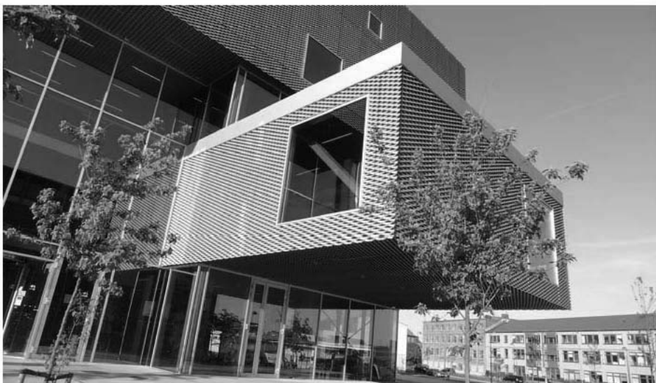
Figur 2. Bygningskroppen er opløst i flere enheder og betrukket med et metal - net, der er ført hen over flere af vinduerne. Ved at trække en af bygningsdelene ud over indgangspartiet skabes en udendørs rummelighed – et rum til velkomst. (Foto: Gitte Marling, maj 2012)

En tredje tendens er, at biblioteket eller bibliotek/kulturhuset involverer sig aktivt i lokalsamfundet på flere planer. Det kan være formelt ved at rumme en borgerservice funktion eller bydelskontor for byudvikling; men det kan også være mere uformelt ved at agere kvarterets dagligstue – eller lokale byrum. Et såkaldt "tredje sted" (Soja 1996). Endelig kan det i et samarbejde mellem offentlige initiativer og frivillige rumme forskellige støttefunktioner for områ-