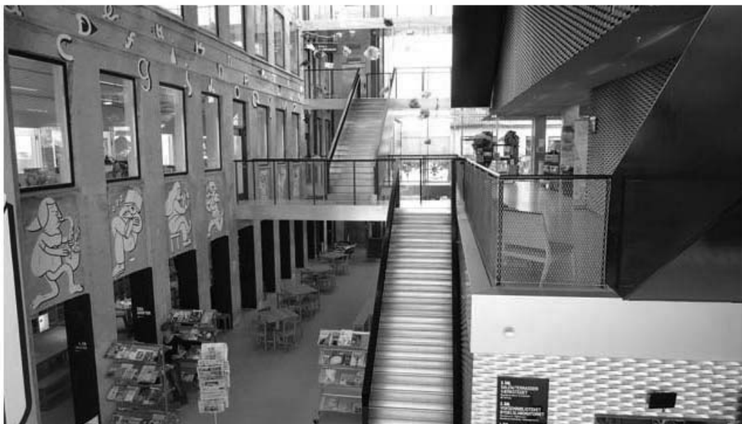
Figur 3. Det indre gaderum: den oprindelige bygning til venstre og den nye til højre. Anvendelsen af materialer viser helt klart, at der er tale om to forskellige bygninger. Den indre gade og trapperum fungerer også som ekstra opholdsareal for cafeen.