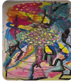
Fig. 2 Det indre og det ydre forbindes ved at bruge spiralen som symbol

Ved at sammenligne det første og det sidste udtryk blev det synligt at en selvregulering havde fundet sted i det terapeutiske forløb, forstærket af at deltagerne ikke havde set deres første udtryk siden de lavede det 6 måneder tidligere. Evnen til at regulere en ubalance i bevidstheden var en af Jungs vigtigste opdagelser relateret til selvets funktion, og jeg mener i dette projekt at have påvist det selv-helende aspekt ved depression. Projektet viser, at når der gives mulighed for aktivt at forholde sig til indre konflikter, så begynder selvregulerings processen at arbejde. Bevægelsen igennem egocide, indvielse og tilbagekomst, kunne findes i drømmenes temaer, kreative udtryk samt terapeutiske dialoger. Det antyder, at en dårlig livskvalitet kan blive starten på en individuations proces, hvilket var et af de temaer som jeg ønskede at undersøge.