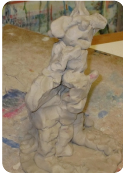
Fig. 1 Figuren har en yderside og en inderside og de er ikke forbundet med hinanden. Hun viser kun ydersiden og længes efter også at vise indersiden .

Fra analysen af den terapeutiske proces hos deltagerne viste det sig at jeg-selv relationen var blevet forbedret. Det fremgik mest tydeligt af sammenligningsanalysen, hvor f.eks. det første og sidste kreative udtryk blev sammenholdt, som vist i følgende eksempel: