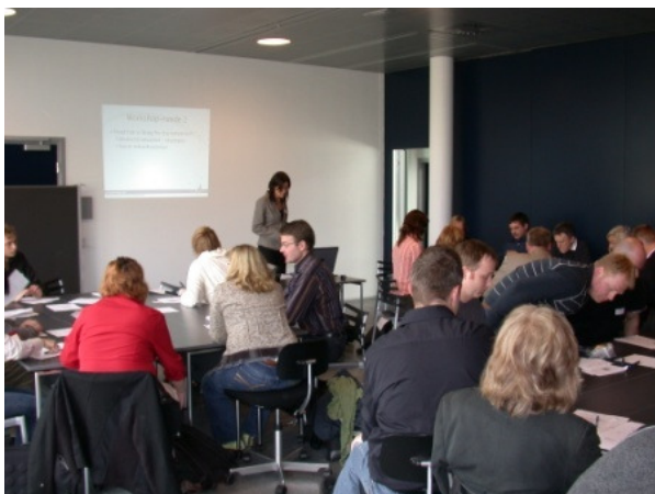
2. netværksseminar afholdes onsdag den 31. maj hos e-Learning Lab. Alle er velkomne.

Der var bred tilfredshed med seminaragen blandt deltagerne. Mange gav udtryk for, at de var glade for at blive introduceret til feltet og var tilfredse med oplæggene. Ligeledes mente de, at det fungerede godt med spillekort til at facilitere diskussionen i grupperne. Og efter således at have diskuteret ivrigt i tre timer blev de 35 deltagere "lukket ud" af seminarlokalet til en