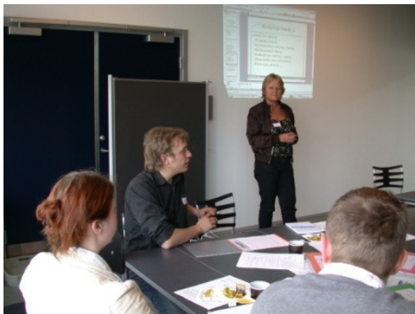
Fremlæggelse af behov og ønsker til netværket efter workshop-runde 2

I forhold til et kommende virtuelt mødested for netværket blev det diskuteret, hvordan medlemmernes rolle skal være. Kort sagt: Skal en hjemmeside for Netværket IKT og Læring være et sted, hvor man som medlem kan 'nyde' - eller skal man også 'yde' for at kunne nyde godt af de ressourcer eller den viden, som netværket tilbyder? Flere af medlemmerne gav udtryk for, at de gerne ville 'yde' eksempelvis i form af indlæg eller sparring i et diskussionsforum eller ved at dele konkrete e-læringsværktøjer eller cases med hinanden.