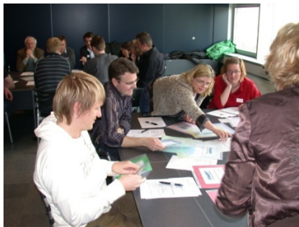
Gruppe 1 diskuterer påstande fra spillekortene i workshop-runde 1

"Begrebet e-læring er gammeldags!", "E-læring gør undervisning billigere!", "E-læring er en vig-