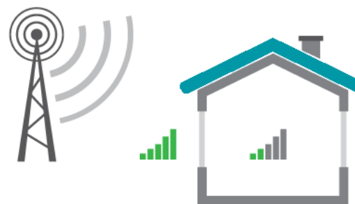
Figur 1. Mobilsignalerne dæmpes, når de passerer gennem vægge og vinduer.

Dækningen fra det overordnede mobilnet i en given bygning afhænger af, hvor meget signalet dæmpes af vægge og vinduer. Dæmpningen af radiosignalet afhænger af flere faktorer såsom materialetype (beton, mursten, træ, gips, glas, metal), materialetykkelse, radiosignalets indfaldsvinkel til huset m.v.