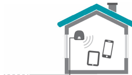
Figur 2. Small cells kan tilsluttes til fastnet bredbånd eller det mobile transmissionsnetværk og udsender mobilsignaler indendørs.

Nogle af mobilsekskaberne markedsfører i dag small cells, foreløbig primært til erhvervsbrug.