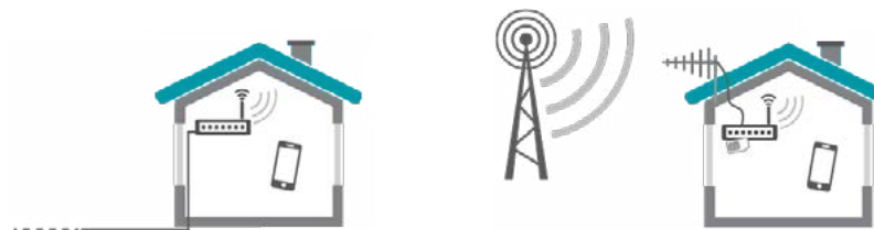
Figur 5. En WiFi-router tilsluttes til internetforbindelsen, enten fastnet eller mobilt bredbånd. Routeren skaber dækning med trådløst internet indendørs.

De fleste nyere mobiltelefoner kan koble sig på et WiFi-net og benytte dette til datakommunikation. WiFi er som udgangspunkt ikke beregnet til taleopkald fra mobiltelefonen, selvom det kan benyttes til tjenester som Skype, Facetime m.v. Der arbejdes dog på at gøre det muligt at benytte WiFi også til almindelig taletelefoni, såkaldt WiFi calling eller Voice over WiFi. Hvis dette bliver udbredt, kan det medvirke til at løse problemerne med dårlig indendørs mobildækning.