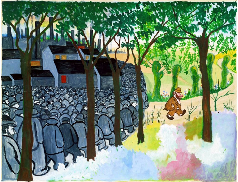
STORM P., TILBAGE TIL NATUREN (1945)