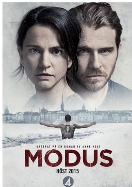
Modus (2015) ▶