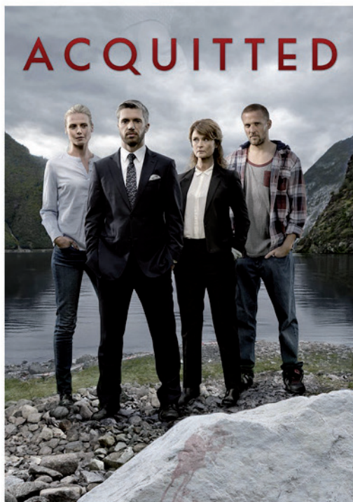
◀ Acquitted (2015-2016)