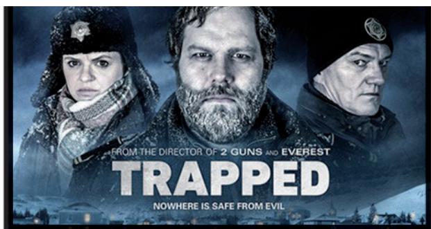
▲ Trapped (2015-)