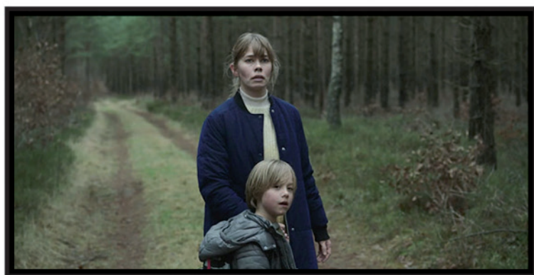
▲ Fortitude (2015-2018)