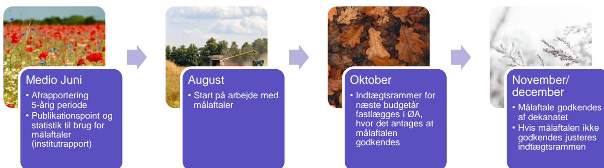
Figur 2 Procesplan for forskningsindikatordelen af målaftalerne

Eksempler på langsigtede mål: andel publikationer i top-10% mest citerede tidsskrifter, forskellige samarbejdsrelationer, FWCI og Scopus dækningsgrad (SC).