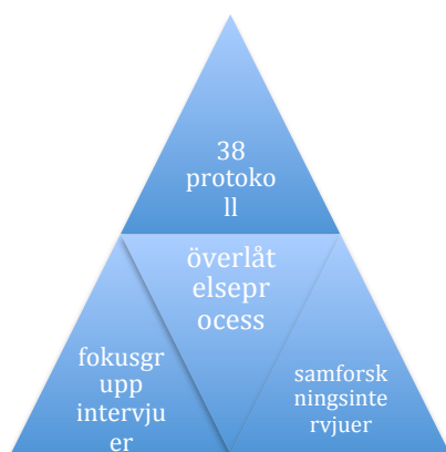
Figur. Triangulering av data insamling

Data analysen var grundad i en hermeneutisk metodik och tematisk analys. Studiens nyckelbegrepp, överlåtelseprocessen i termer av interaktions och relationsformer (Mårtenson Blom, 2010), utforskades genom triangulering av data: