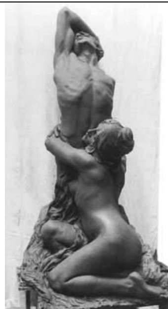
Rudolph Tegner, Jordbundet (1897-98)

Emma Gad, Takt og Tone (1994:11 opr. 1918)