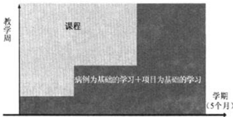
图 2 奥尔堡大学医学院 PBL 模式

2006 年,奥尔堡大学新成立的医学院除了保留以项目为基础的 PBL 教学模式之外,还采用了以病例为基础的 PBL 教学模式。这两种 PBL 教学模式的结合,构成了奥尔堡大学医学院的 PBL 教学特色,详见图 2。