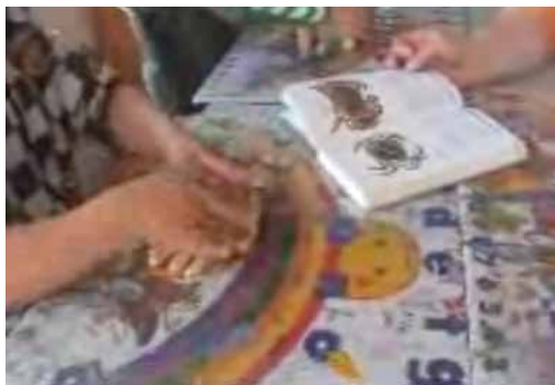
Figur 3. Tobias der modellerer krabbe efter billedet.

Sidstnævnte kan virke uoverskuelig for de enkelte grupper trods den klare besked, og her tyder analysen af resultaterne generelt på, at mindre grupper og den voksnes fokuserede opmærksomhed ligeledes kan hjælpe dialogen på vej. I børnenes undersøgelse af inspirationskasserne (se ovenfor), viste flere eksempler, at børn i mindre gruppe var gode til at hjælpe og støtte hinanden i arbejdet med at opstiller hypoteser. Ved fælles dialog om tingene i kasserne, og med støtte enten af de andre børn i gruppen eller af en voksen, der tog sig tid til at hjælpe børnene, høre på hvad de sagde og på det grundlag at guide dem videre, var det for de fleste grupper muligt at komme frem til en fælles hypotese, som den gennemgæede dialog ovenfor (tabel 2) er et eksempel på. Begrebet addressivity (Kubli, 2005, s. 509) kan med rette anvendes om denne form for fælles fokus. Begrebet referer både til Bakhtin og Vygotskys tanker om fokuserethed i dialogen (fx i forbindelse med zonen for nærmeste udvikling), og er betegnende for den fokus der er i en dialog "... og som ikke efterlader nogen sten uendt i forsøget på at forstå afsenderen [af spørgsmålet eller tankerækken]" (ibid., s. 509, forfatterens oversættelse).